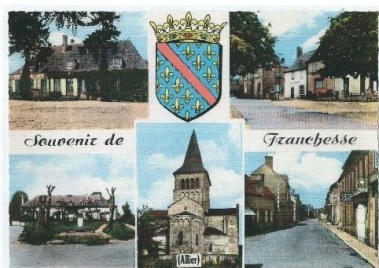
Commune de Franchesse, octobre 2022

Le document n'a aucune prétention historique ou scientifique, simplement le souvenir d'activités dans le village dont beaucoup encore se souviennent.